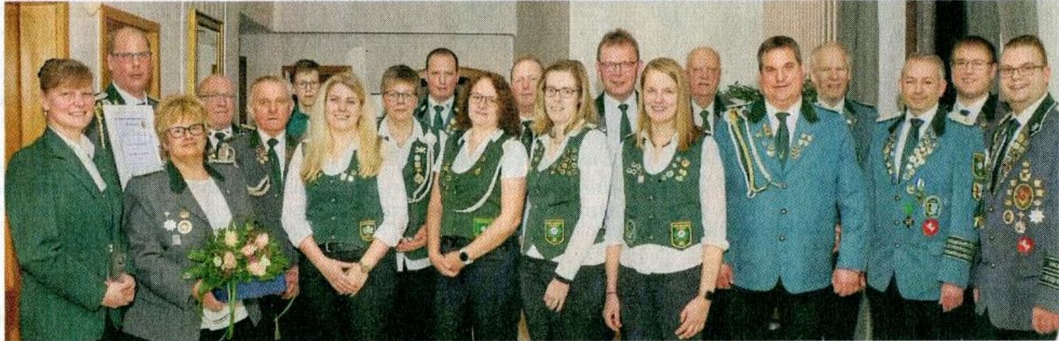
Die Geehrten und Gewählten der Kreisdelegiertentagung.

Kreisdelegierte tagen bei Puvogel / Rückschau und Vorschau