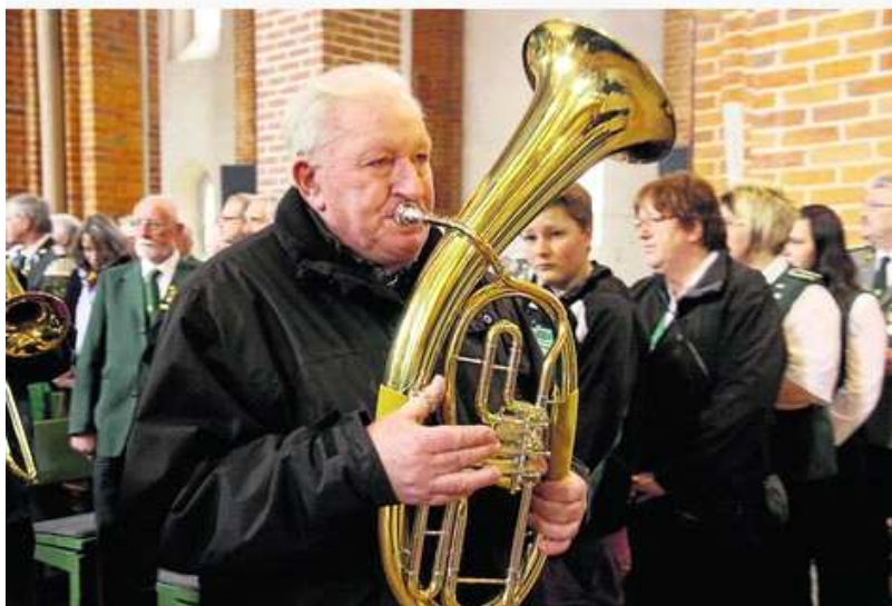
Festlicher Rahmen: Posaunenklänge beim Umzug und im Gottesdienst in der Bassumer Stiftskirche.

Bassum - Von Anke Sedel, Heiner Büntemeyer und Dieter Niederheide BASSUM · Eine Stadt sieht grün: Mit einem gehaltvollen Programm zeigte der rund 135 000 Mitglieder starke Nordwestdeutsche Schützenbund (NWDSB) zwei Tage lang in Bassum Präsenz – nicht immer bei eitel Sonnenschein: Düstere Gewitterwolken überschatteten die Delegiertentagung im neuen Landesleistungszentrum. Dort wären die Wahlen zum Gesamtpräsidium, das immerhin 984 Vereine vertritt, fast gescheitert.