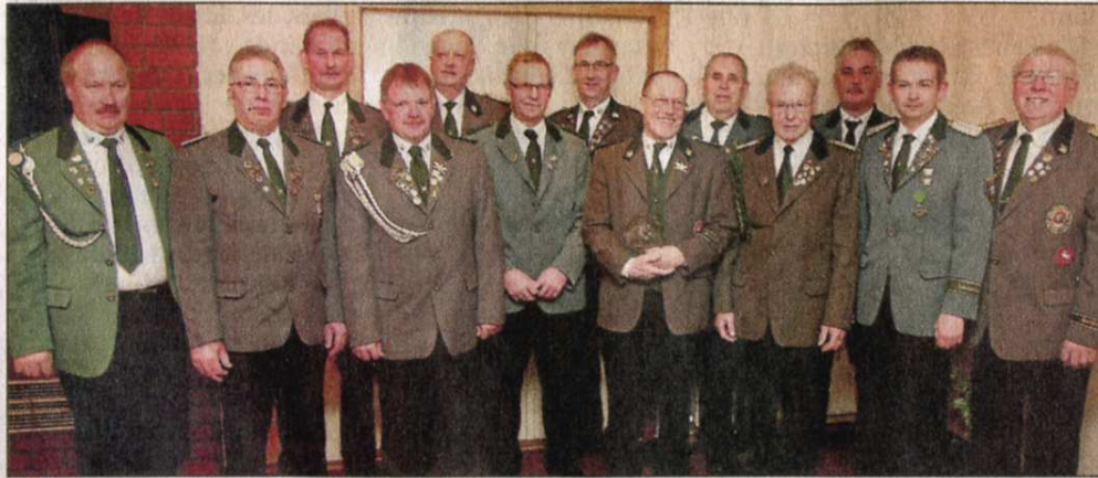
Die geehrten Schützen während der Delegiertentagung des Kreisschützenverbands Bruchhausen-Vilsen in Engeln.

Mit Bedauern teilte der Präsident mit, dass der Schützenverein Scholen Anfang des Jahres aus dem Bezirks-schützenverband aus-