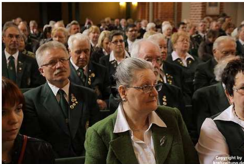
Andächtiges Publikum bei der Fahnenweihe