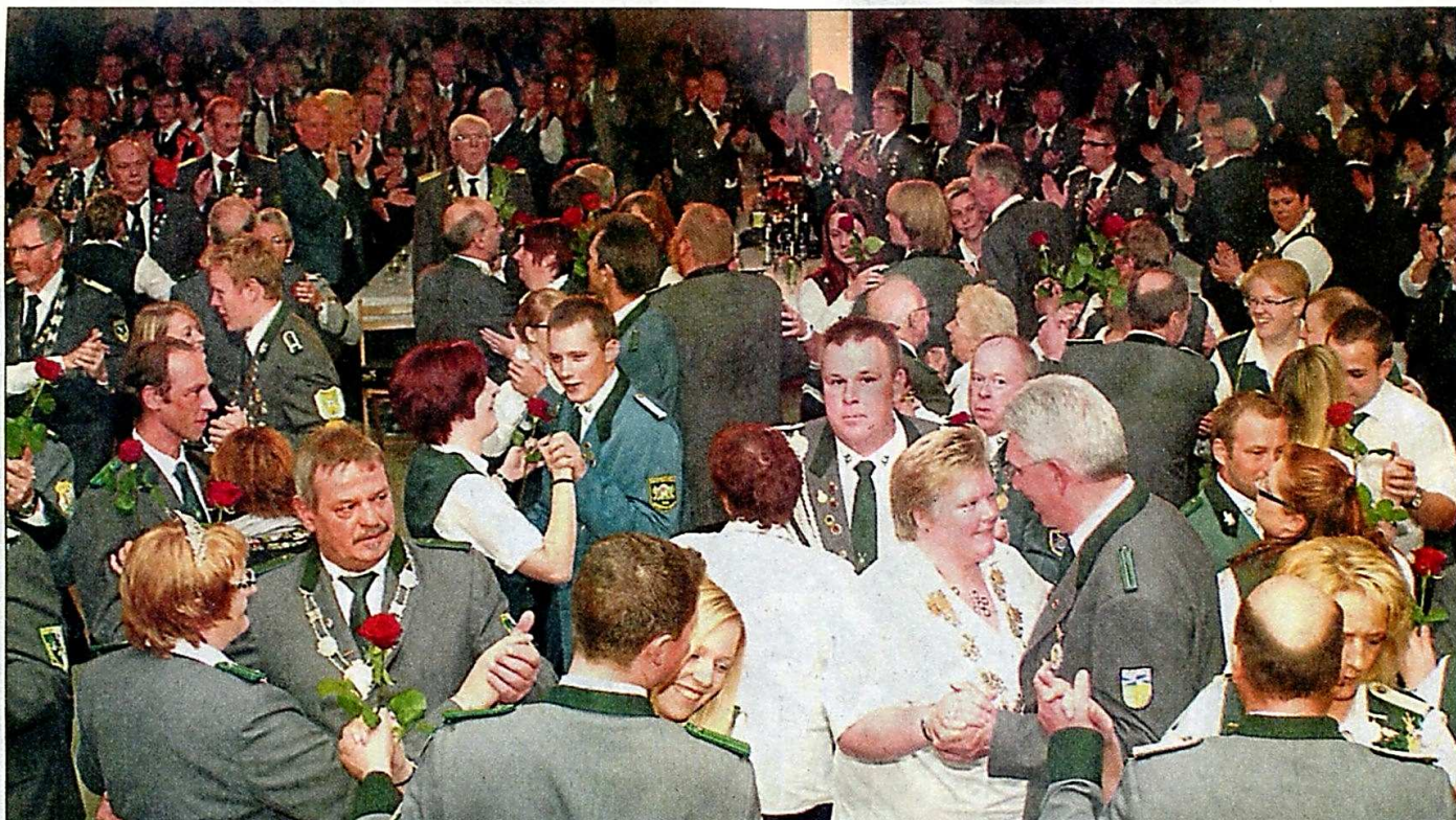
Beim Ehrentanz wird es eng: Majestäten aus 42 Vereinen suchen ein freies Plätzchen auf der Tanzfläche.