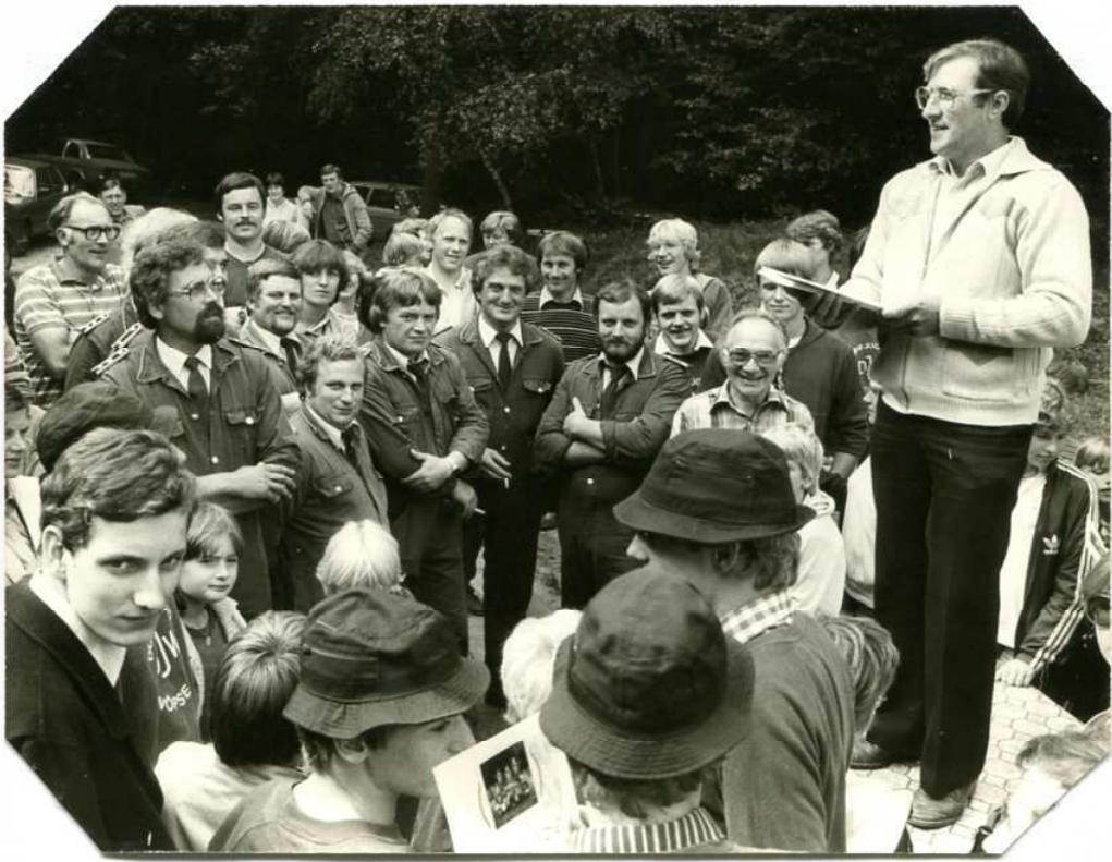
Tauziehen Siegerehrung 1983