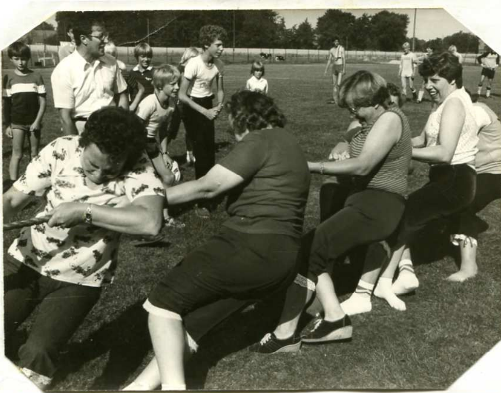
IHRE KRÄFTE maßen am Sonntag in der Halbzeitpause des Pokalendspiels auf dem Sportplatz in Scholen vier Damenmannschaften aus Scholen, Berxen, Wöpsse und Hohenmoor. Trotz aller Anstrengungen der Damen aus Berxen (unser Foto) blieb am Ende die Scholener Damenmannschaft Sieger. Zur Stärkung gab es schließlich für jede Mannschaft eine große Torte vom TV Scholen.