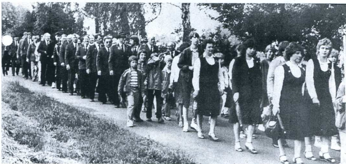
DER FESTUMZUG ANLÄSSLICH des Berxener Jubiläums-Schützenfestes wies eine beträchtliche Länge auf.