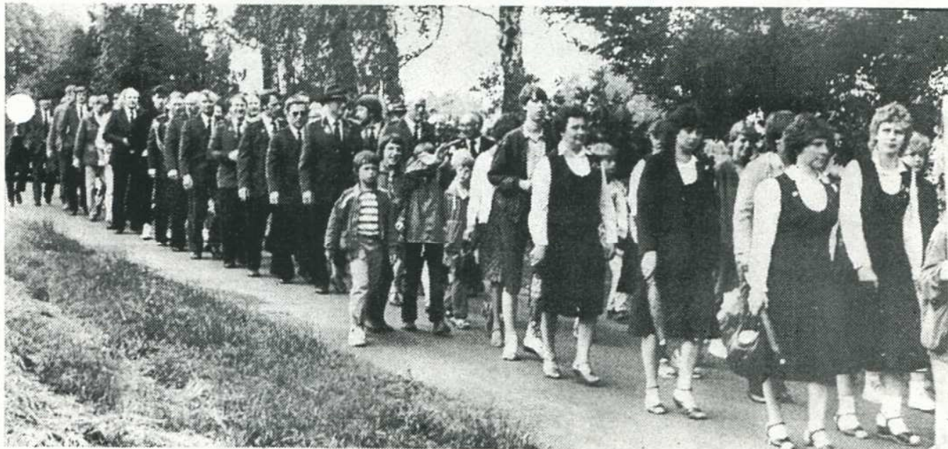
DER FESTUMZUG ANLÄSSLICH des Berxener Jubiläums-Schützenfestes wies eine beträchtliche Länge auf.