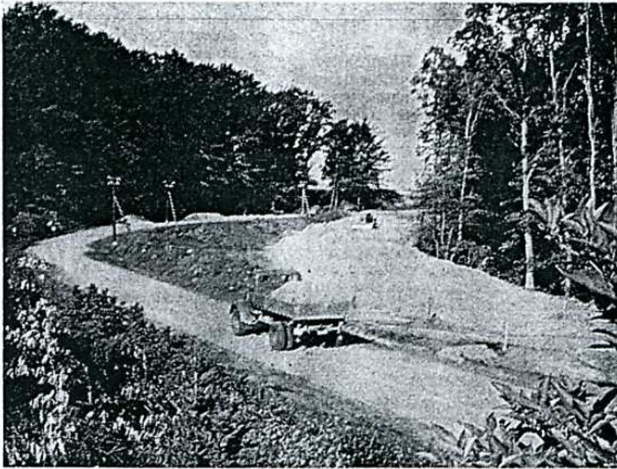
Die neue Trasse durch das Berxer Holz (rechts) und die alte schmale Straße (links). Die Bäume des Holzes auf der rechten Seite reichten früher bis unmittelbar an die alte Straße heran.

Umfangreiche Straßenverlegung im Berxer Holz