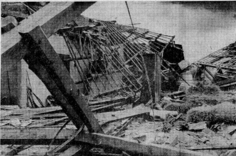
EIN BILD DER VERWÜSTUNG bot sich auf manchen Gehöften des Kreises Grafschaft Hoya, der gestern von orkanartigen Stürmen mit Böen bis zu Stärke 12 und darüber heimgesucht wurde.

In Niedersachsen gab es allein bei Braunschweig fünf Tote. Auf der Bundesstraße 214 im Kreis Braunschweig wurde eine Frau in ihrem Auto von einem umstürzenden Baum erschlagen. Auf der Autobahn bei Braunschweig wurde eine 21jährige Frau mit ihrem Wagen gegen einen Brückenpfeiler geschleudert und getötet. Auf dem Gelände der Technischen Universität in Braunschweig erlitt eine Studentin von herabstürzenden Steinen einer Fassade tödliche Verletzungen. In Hoopen, Kreis Diepholz, wurde eine 57jährige Bäuerin von einem umstürzenden Scheunentor erschlagen. In Bremen gab es ebenfalls mehrere Tote. (Ausführliche Berichte auf den Lokalseiten sowie auf den Seiten Weltspiegel und Bremen.)